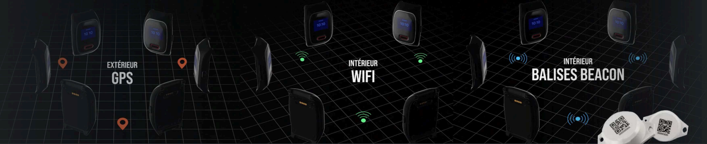
*Balises de localisation bluetooth

Grâce à des récepteur GNSS (GPS, Glonass, Galileo) et par balises bluetooth (en option pour géolocalisation Indoor), le D-3000 peut délivrer une information de localisation dans son message d'alarme indiquant les dernières balises de localisation enregistrée. Dans certaines conditions le D-3000 peut également délivrer une information de géolocalisation Wifi.